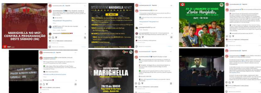
Figura 7 – Postagens divulgam eventos