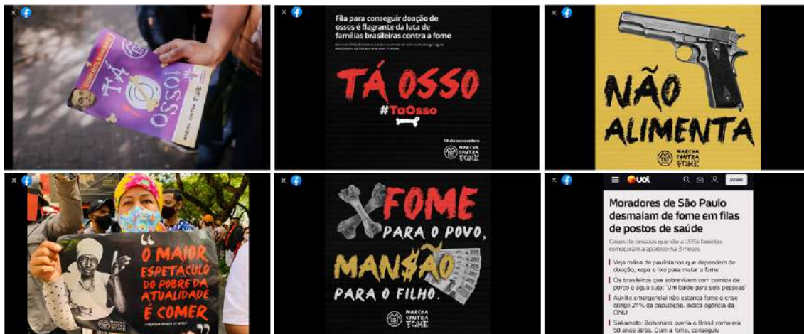
Figura 12– Marcha contra a fome