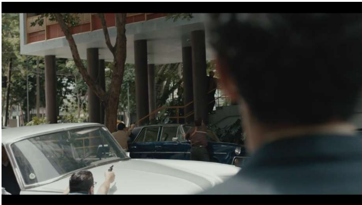
Figura 1 – A violência avistada