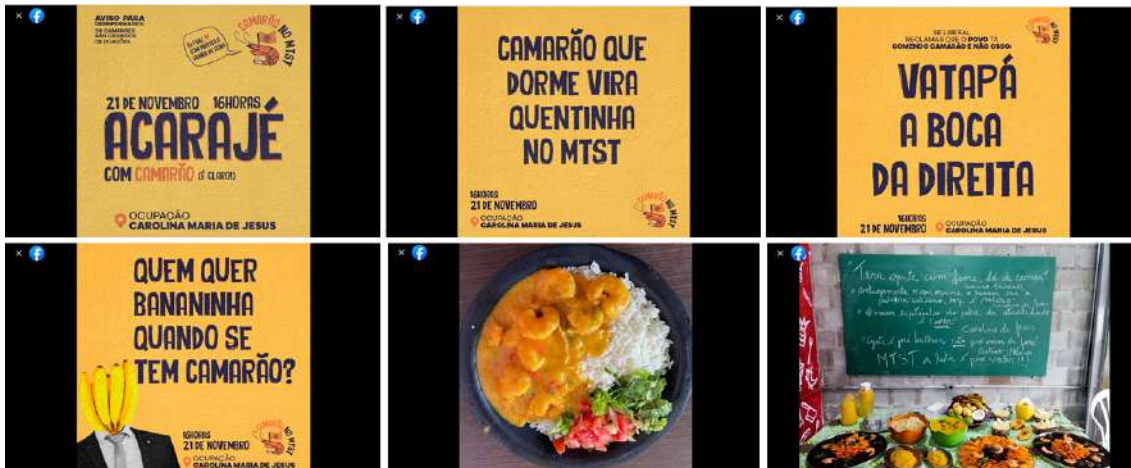
Figura 11– Ataques a adversários políticos