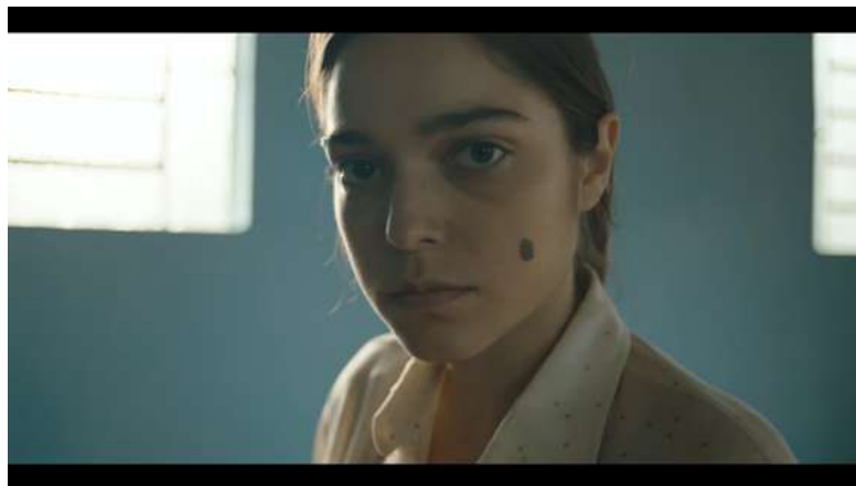
Figura 6 – Fusão de olhares