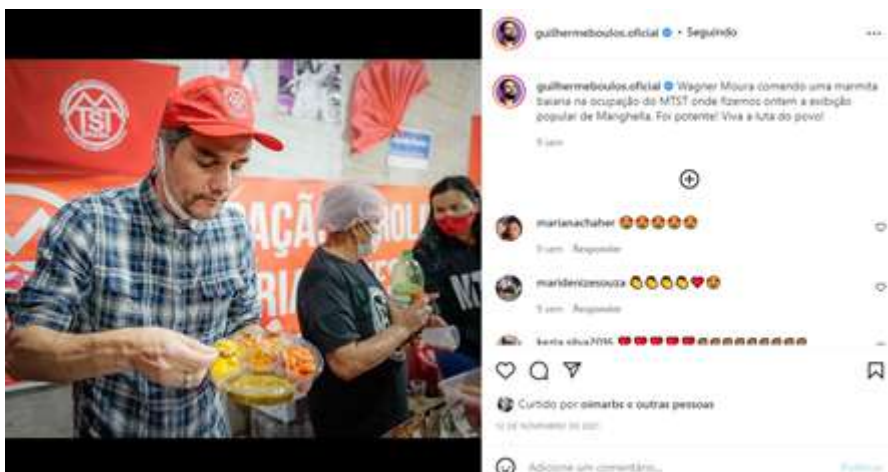
Figura 08 – Wagner Moura com uma marmita baiana