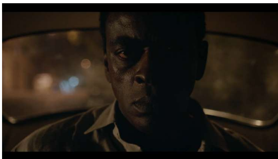
Figura 5 – Fusão de olhares

Fonte: Frame do filme Marighella / Globoplay.