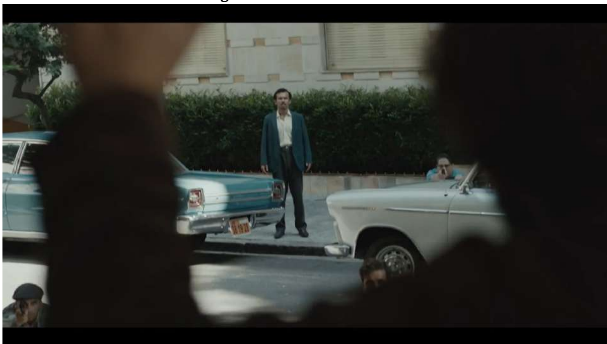
Figura 2 – A violência sofrida