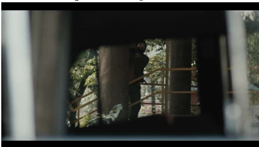
Figura 3 – O olhar vigilante e delator