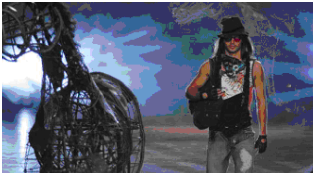
Fig. 10: SPFW: inverno 2006 – Cavalera

Assim, o que se destaca na atualidade das mídias-passarelas é a valorização dos corpos masculino e feminino, neste momento em que já se consolidou a mise en scène dos desfiles, que antes de mostrarem apenas os conceitos de uma “nova” moda, são envoltos por toda uma ambientação que incorpora tais conceitos, respaldada por apresentações performáticas que contribuem para dar maior visibilidade e credibilidade ao que se mostra na mídia-passarela (fig. 10 e fig. 11) .