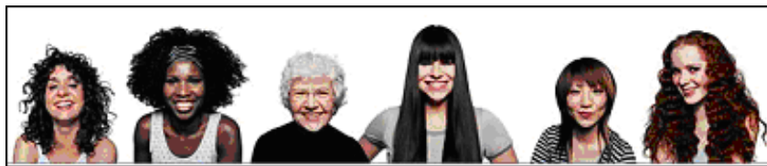
Fig. 7: Fotos de modelos da Campanha Dove Para a Real Beleza , que tem como slogan “O sol nasceu para todas”.

Nas duas primeira figuras, os corpos das modelos fogem de padrões sociais preestabelecidos como ideal de beleza. Apesar disso, as passarelas os integram também em suas apresentações, que, como sabemos, estabelecem referências a vários discursos que são veiculados pelas sociedades, a exemplo do que se vê na figura 7, na campanha da Dove, que incentiva a valorização da diferença por meio da auto-estima de mulheres com belezas díspares.