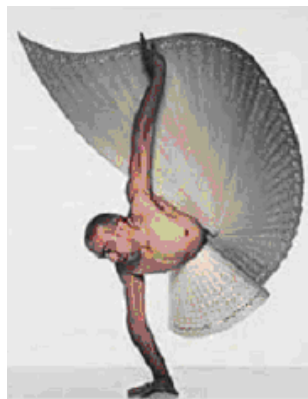
Fig. 9: Foto de Steeve Seal para a divulgação da coleção de moda do estilista inglês Alexander McQueen.

Na construção de um discurso que se pauta na diferença, várias publicações trazem corpos “diferentes” às suas capas ou como ancoragens de matérias. Com eles, rediscute-se uma nova ordem estética para o belo, integrando a diversas possibilidades de ele ser representado figurativamente nas mídias em geral. Assim, ao mesmo tempo que o “diferente” pode causar repulsão, ele também desencadeia um percurso de atração do olhar, pautado sobretudo na curiosidade e, na seqüência da leitura visual que se faz dele, emerge um outro sentido para o belo. Na primeira figura, a ambientação fetichista que o corpo feminino apresenta, envolto por uma tonalidade infanto-juvenil, contrapõe-se ao rosto “descarnado” que compõe o visual figurativo da mulher, apelando principalmente para o sentido do tato. Na segunda figura, a ausência dos membros inferiores mostra-se como uma potência para o desenvolvimento de uma nova estética na proposta de um olhar encorajador frente às diferenças corporais que são revisitadas e reinterpretadas. A revisão desse corpo publicitário que se opõe aos do cânone e à proposta estética da ausência manifestadas nesses corpos exige um repensar da forma, da roupa, suas funções, sua estética e conseqüentemente da inserção de novos valores na leitura e na valoração dessas imagens.