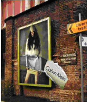
Fig. 12: Campanha Publicitária da Calvin Klein

também corpos publicitários e, portanto, ao mesmo tempo que somos uma vitrina de nós mesmos, desenvolvemos estratégias de manipulação sobre o “outro”, quer com os conteúdos da sensualidade/erotização, quer com outros conteúdos discursivos.