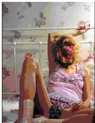
Fig. 8: Babydoll pink , calcinha de leopardo e bota cowboy .

determinados contextos sócio-históricos das culturas. Apesar disso, não se pode dizer que as campanhas e apresentações de moda estão ainda muito timidamente dando importância a corpos menos valorizados pelas culturas, a exemplo do que se vê em várias revistas de moda em todo o mundo (fig. 8 e fig. 9).