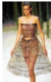
Fig. 2: Paris: verão 2006 – Issey Miyake

Nos dois casos, a moda “capa” e a moda “crinolina” são retomadas e ressignificadas com aspectos de mundo contemporâneo que engloba seus momentos de produção. Na primeira figura, há de ser observado como se insere na construção geométrica do conjunto da roupa o percurso do olhar que deve guiar o observador, culminando com a orientação visual para a genitália masculina, diferentemente das funções atribuídas a capas em manifestações de moda de outros períodos. Na segunda figura, a crinolina é construída com um material transparente, e de modo diverso à de outros tempos mostra-se como um cerco para a visualidade da lingerie da mulher, trabalhada, como o bustiê, com materiais plásticos e transparentes.