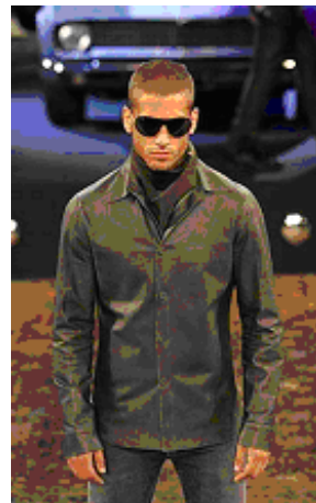
Fig. 11: SPFW: inverno 2006 – Ricardo Almeida

Cavalera apresenta um streetwear que se baseia numa ambientação fantástica de pós-guerra; na segunda, o estilista insere seus modelos, corpos e roupas, numa passarela que se apresenta também como uma exposição de carros esportivos.