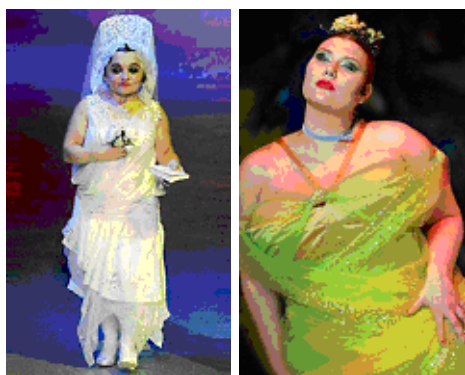
Fig. 5 e 6: Paris: verão 2006 – John Galliano

É incontestável, nos dias atuais, a proliferação e a força que tem um discurso social pautado no respeito às diferenças, sejam elas políticas, econômicas, de crença, de gosto, de povos etc. Quanto à moda, justamente por causa da expressão de subjetividade que ela faz ressaltar e mesmo aporta aos usuários, ela também se respalda nesse discurso, trazendo às campanhas publicitárias e às passarelas corpos que devem ser valorizados. Nesse sentido, as figuras abaixo (fig. 5 e fig. 6), representativas do prêt-à-porter de John Galliano, verão 2006, são uma voz nas passarelas contra a estigmatização de corpos-modelares, segundo os discursos vorazes que incentivam a tirania de corpos que perseguem um ideal de perfeição. Na mesma linha de raciocínio podem ser inseridas as campanhas publicitárias (fig. 7) que dão voz e vez ao respeito às diferenças, levando em consideração aquilo que se exalta de belo para corpos que, num primeiro momento, poderiam não ser considerados como tais, dada a padronização que o discurso da moda comercial instaura nas sociedades.