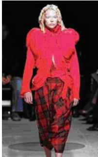
Fig. 3: Paris: verão 2006 – Comme des garçons

subjetividade. É, pois, seguindo este caminho que os estilistas-criadores desenvolvem seu trabalho, pensando, de um lado, na utilização de tecnologias provenientes de nossa contemporaneidade para sua produção e, de outro lado, na criação de moda que possa atender a um número maior de usuários (fig. 3 e fig. 4).