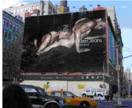
Fig. 13: Campanha Publicitária da Calvin Klein

Diversas associações diretas podem ser feitas entre determinado produto de moda e a sensualidade e a erotização de corpos, como pode ser observado em ambas as campanhas da Calvin Klein. Na primeira figura, o texto propõe a construção discursiva de um observador voyeur , que vê através da roupa a lingerie da mulher, envolta por uma pose sensual e que se apresenta como querendo mostrar-se. Na segunda, a marca divulga a erotização por meio da cena figurativa apresentada: de costas, o homem se deixa tocar pela mulher, que o despe lentamente, num ato pré-sexual.